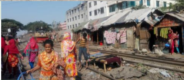
In alto baraccopoli a Dhaka.