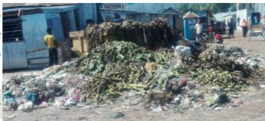
Spazzatura a Khulna in Bangladesh.

Scarti, rifiuti: fotografia di un territorio, di una società, di una cultura.