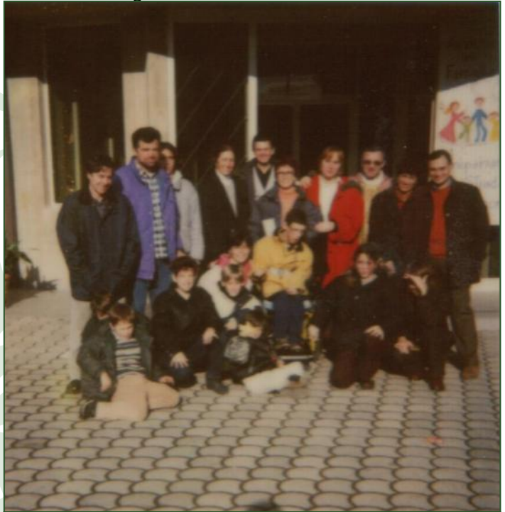
Ventuno anni fa. Prima foto del neonato Gruppo Pang'onoPang'ono